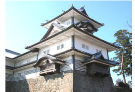
金城城菱櫓(イメージ)