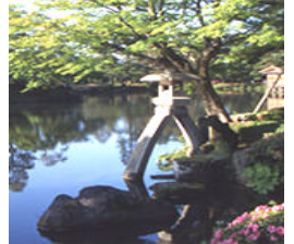
兼六園ことじとうろう(イメージ)