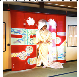
花嫁のれん館(イメージ)